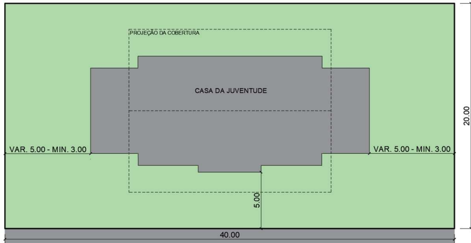
Figura 01: Implantação ideal do equipamento em lote urbano.

A configuração e dimensões podem sofrer variações desde que não prejudique a implantação da edificação e o atendimento dos recuos mínimos conforme a legislação de cada Município.