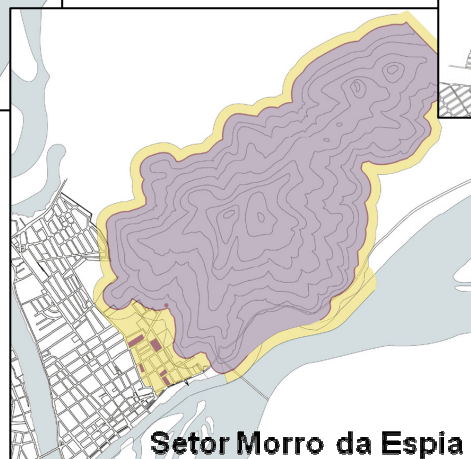
Setor Morro da Espia